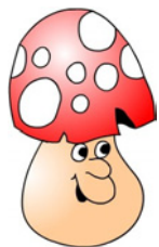
FIGURE NELLA GRIGLIA

SISTEMA LE NOVE FIGURE, DOPO AVERLE RI TAGLIATE, NELLE NOVE CASELLE DELLA GRIGLIA A SEGUENDO LE INDICAZIONI!!!